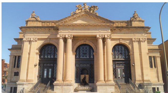
Situé dans l'édifice de l'ancien bain de Maisonneuve construit entre 1914-1915 l'Atelier d'histoire Mercier-Hochelaga Maisonneuve est une porte ouverte sur le patrimoine d'un quartier qui s'est construit le long du fleuve et de son port.

L'AMHM fonctionne grâce à un soutien financier de l'arrondissement, l'utilisation gratuite d'une belle salle dans l'édifice rénové de l'ancien bain Morgan et certains projets de la Ville de Montréal comme une carte interactive avec des photos géolocalisées. ■