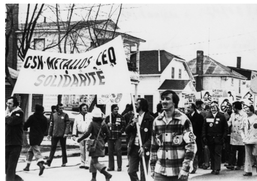
Grève de 1975 dans l'amiante.

Au cours de la grève, la CSN dévoile les premiers résultats d'une étude réalisée par le Dr Selikoff sur l'amiantose et décide d'inclure cette revendication, ce qui n'a pas été prévu dans l'entente avec les Métallos. Durant l'été, le conflit s'enlise. Le ministre des Ressources naturelles fait voter la loi 52 qui bonifie l'indemnisation aux victimes de maladies industrielles comme l'amiantose et la silicose. Une autre répercussion