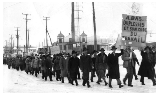
Parade durant la grève de 1949.

Au terme du conflit, les briseurs de grève resteront à l'emploi de la Compagnie Canadian Johns-Manville, le plus gros employeur et les grévistes seront rappelés au travail selon les nécessités de la production. Le syndicat a dû consentir à la création d'un tribunal d'arbitrage. Pour la poussière, la compagnie s'engage à poursuivre ses efforts. Sur le plan salarial, une sentence d'un conseil arbitral leur accorde 10 cents l'heure soit 5 cents de