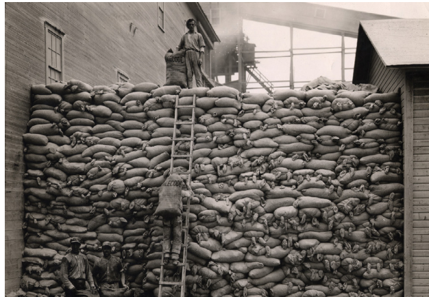
Empilage de sacs d'amiante par les travailleurs à la mine Maple Leaf en 1946.

Le 27 avril 2015, le Centre d'archives inaugure ses nouveaux locaux à l'intérieur du Cégep de Thetford. Le projet a permis de relocaliser le Centre d'archives près de la bibliothèque municipale et collégiale, d'aménager une aire d'accueil, des espaces de bureau pour le traitement des archives et une salle de consultation